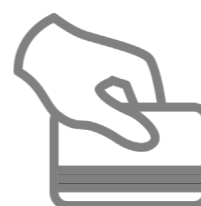
Carta di Credito